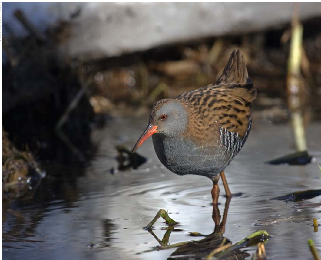
Vattenrall häckar regelbundet ivid Alhagens våtmark.

Alhagen utanför Nynäshamn är en lättillgänglig våtmark med ett rikt fågelliv – året runt. Den är anlagd och kom till som en följd av ett politiskt beslut om ytterligare rening vid avloppsreningsverken. I Nynäshamn valde man en våtmark framför ett nytt reningssteg.