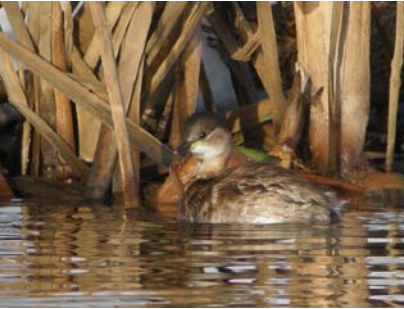
Övervintrande smådopping. Alhagen 10 januari 2011.

ten norrifrån. Större delen av området var tidigare åkermark som brukades av Nynäs gods.