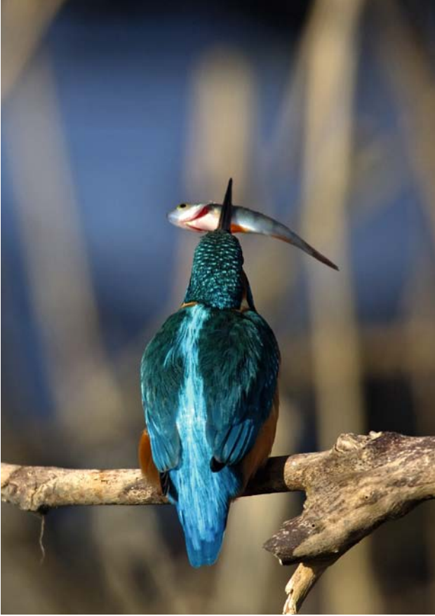
Kungsfiskare med en nyfångad abborre.

anlagt sammanlagt sex kilometer gångväg, som används flitigt av fågelskådare, ryttare, vandrare, joggare, hundägare, familjer på utflykt m.fl. Även Naturskolan använder området regelbundet i sin undervisning.