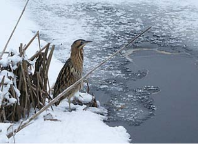
Även rödrom övervintrar i Alhagens våtmark, detta exemplar vintern 2009/2010.